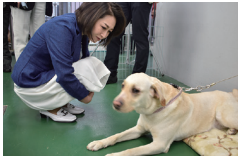
●日本盲導犬協会神奈川訓練センター視察