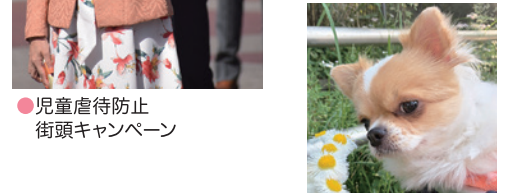
●児童虐待防止 街頭キャンペーン